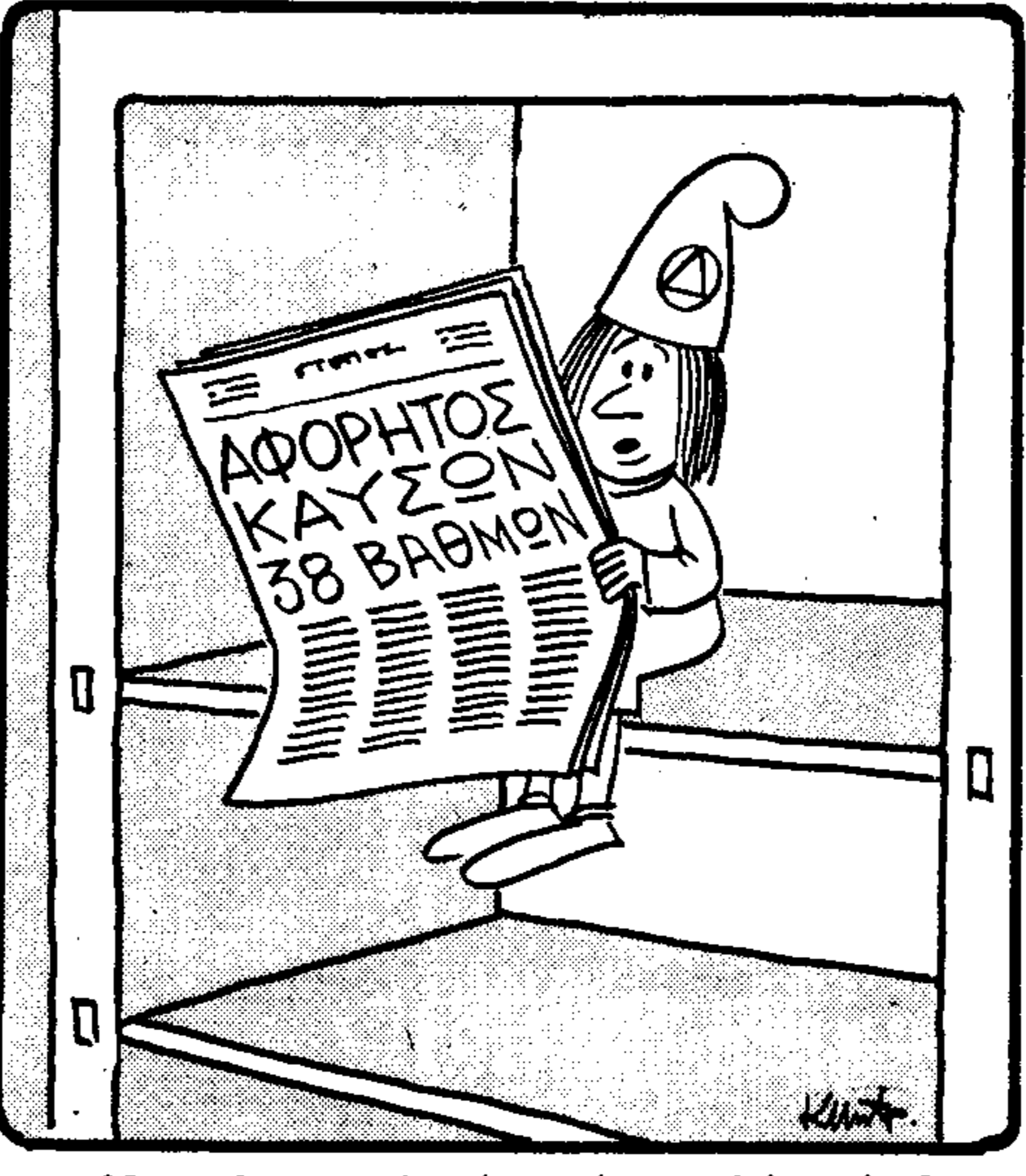
— Ὅρες - ὄρες λοιπόν, γίνεται ὑποφερτὴ ἡ κατάμυξιν...