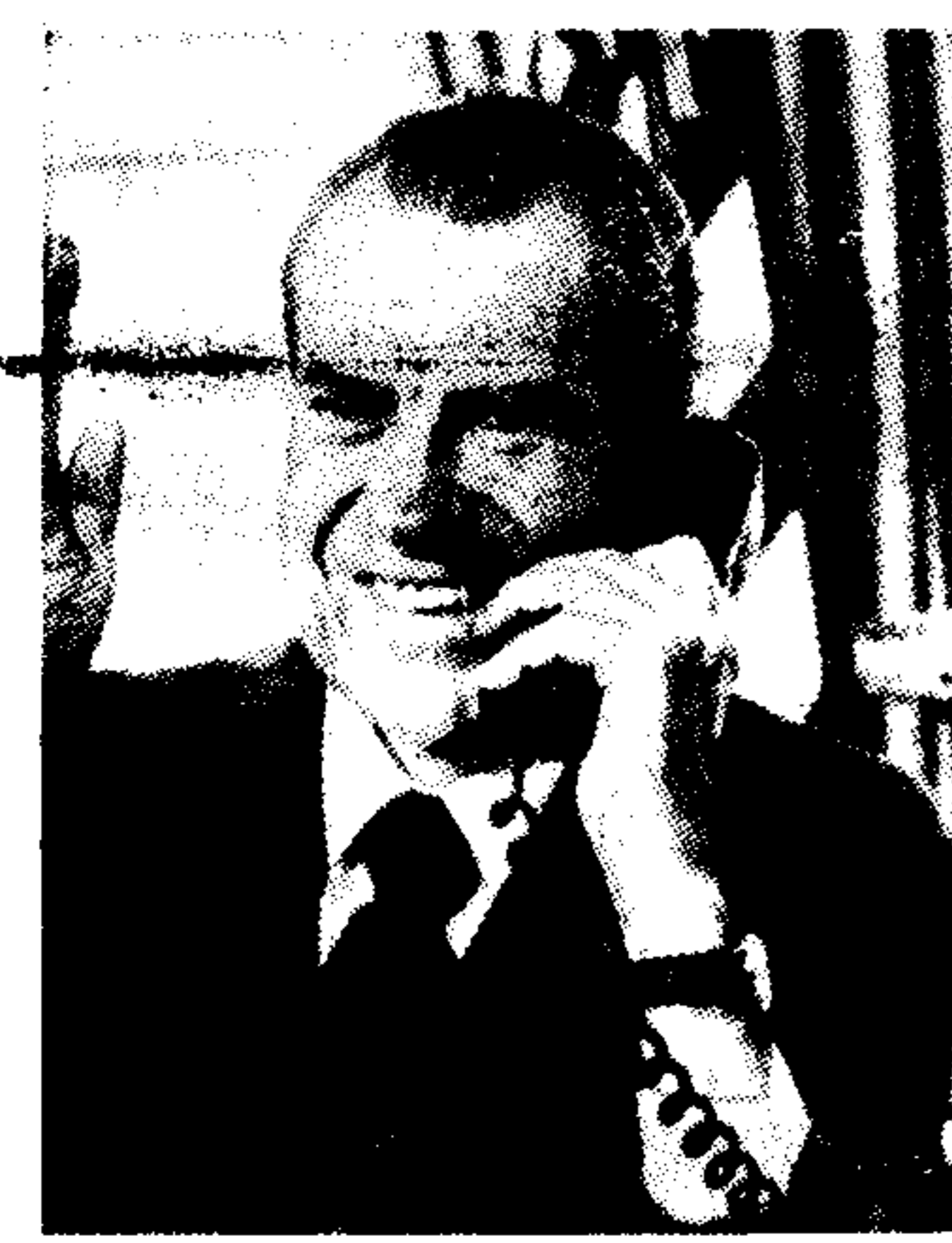
Ὁ Πρόεδρος Νίξον